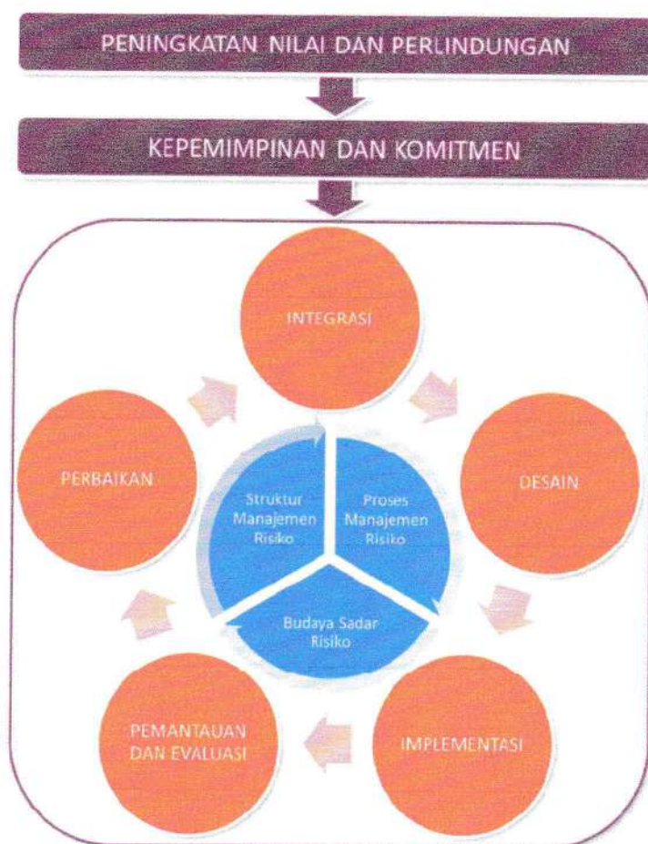
Gambar 1. Kerangka Kerja Manajemen Risiko SPBE

Komponen dasar dari kerangka kerja ini terdiri atas prinsip mengenai peningkatan nilai dan perlindungan, kepemimpinan dan komitmen, serta proses dan tata kelola Manajemen Risiko SPBE sebagaimana terlihat pada Gambar 1.