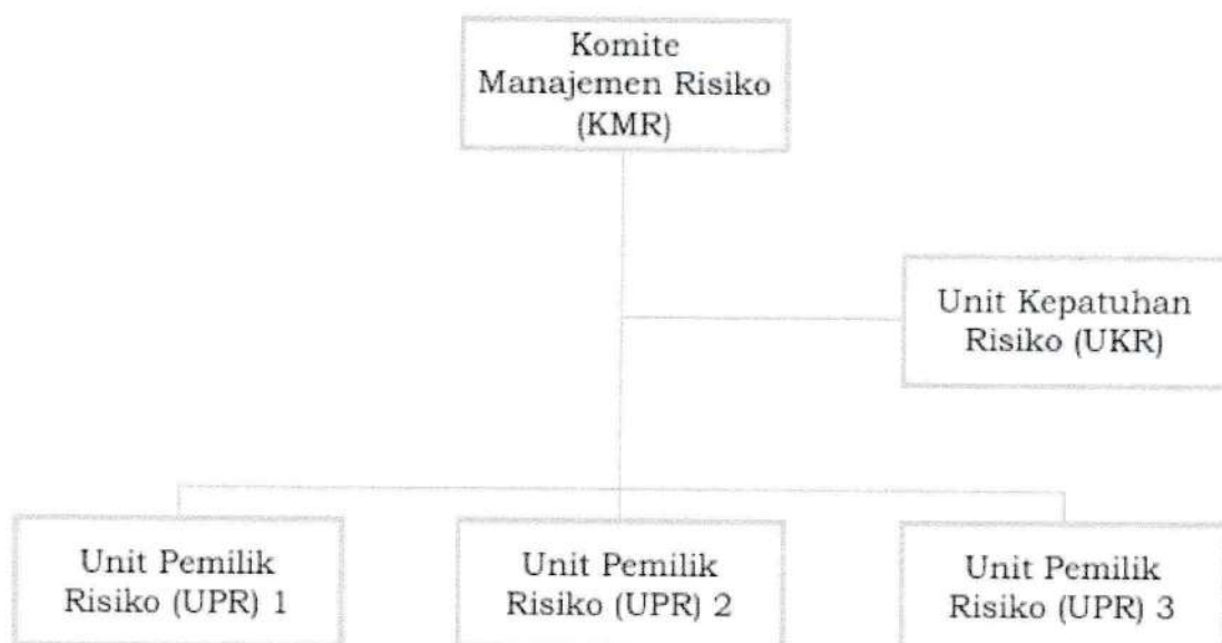
Gambar 5. Struktur Manajemen Risiko SPBE

Gambar 5 mengilustrasikan struktur Manajemen Risiko SPBE seperti di bawah ini